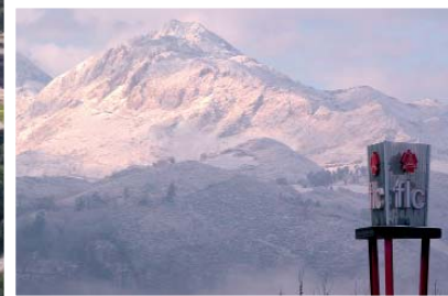
Instalaciones RIBERA DE ARRIBA